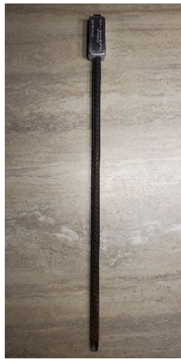
1a – Image d'un repère (borne-terminus)