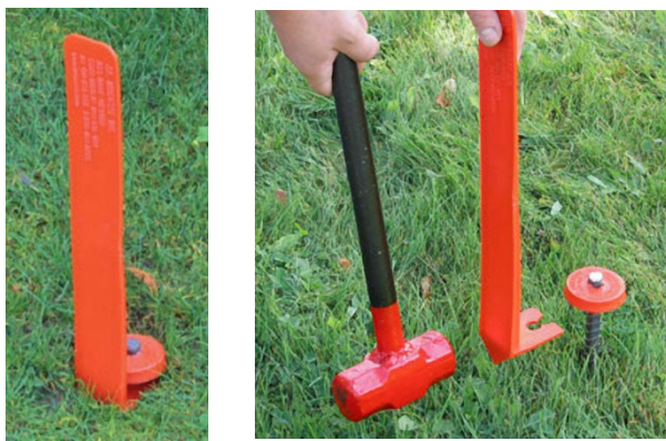
2a – Images d'une balise d'identification (repère-médaille à titre indicatif uniquement)